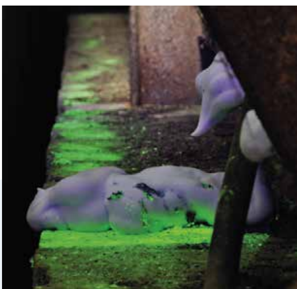
Ontoegankelijk gat in de muur.